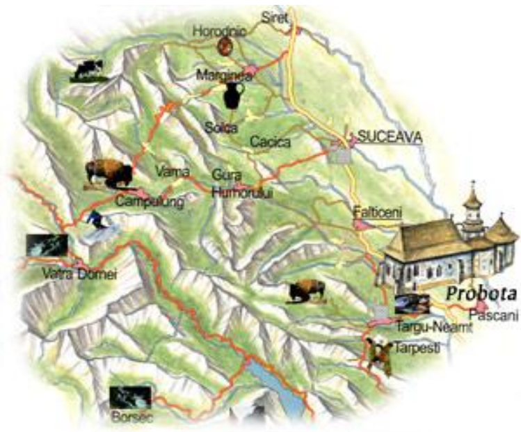
Fig. 1 – Amplasarea geografică a Mănăstirii Probota ( www.romanianmonasteries.org )