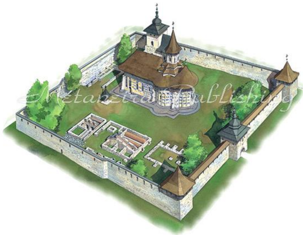
Fig. 2 – Mănăstirea Probota