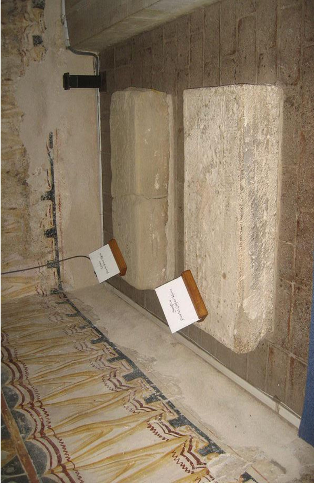
Fig. 4 – Prim-plan cu pietrele funerare ale Samfirei și Eftimiei.