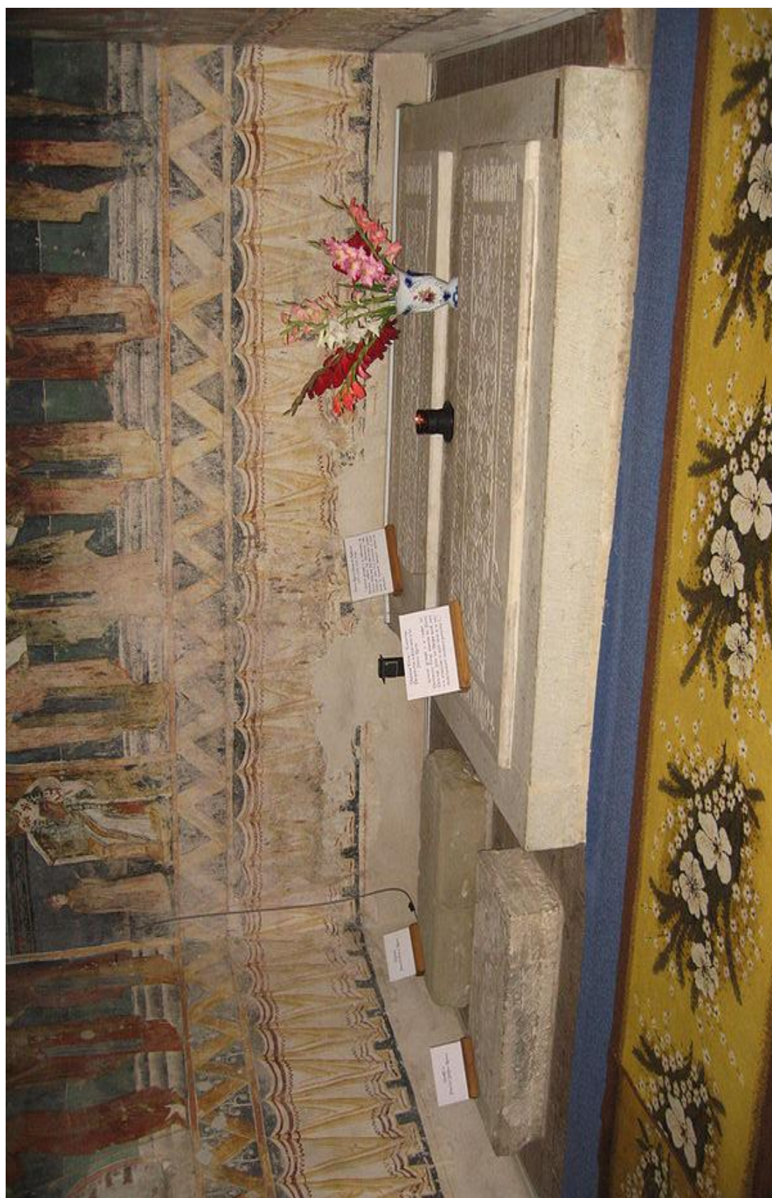
Fig. 3 – Groznița bisericii Mănăstirii Probota, latura sudică, după restaurare, cu pietrele funerare aparținând voievodului Petru Rareș, Doamnei Elena, Samfirei și Eftimiei.